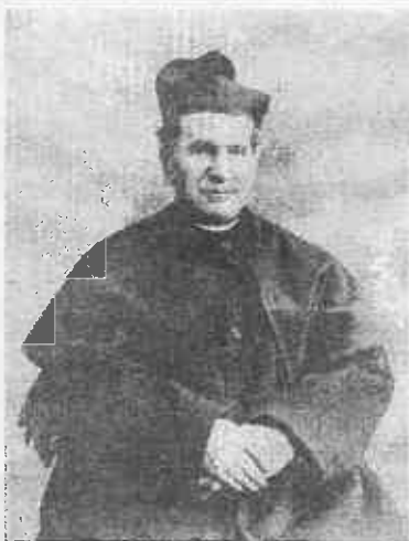
Card. Don Bosco, Don Bosco, Turin, 1888