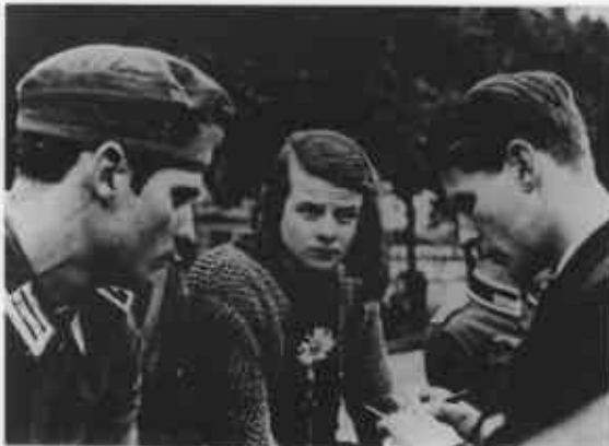
Hans und Sophie Scholl und die „Weisse Rose“ Widerstandsgruppe